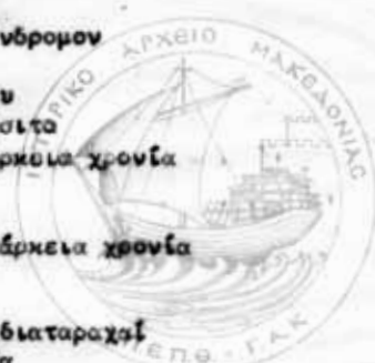
Στατιστική του Ιανουαρίου 1968 του Δημοτικού Ιατρείου Καλαμαριάς με τα νοσήματα των ασθενών, σύμφωνα με τις διαγνώσεις των γιατρών.